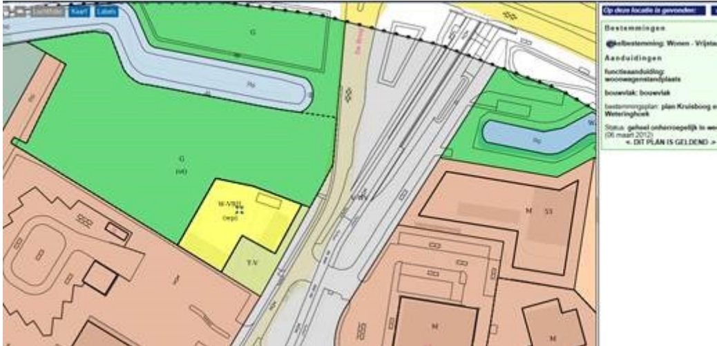
Uitsnede verbeelding BP Kruisboog en Weteringhoek

De woonwagenlocatie De Brug is gelegen in het gebied waarop het bestemmingsplan Kruisboog en Weteringhoek van toepassing is en heeft hierin de functie wonen. De locatie heeft een enkelbestemming Wonen – Vrijstaand met functieaanduiding woonwagenstandplaats en enkelbestemming Tuin – Voortuin.